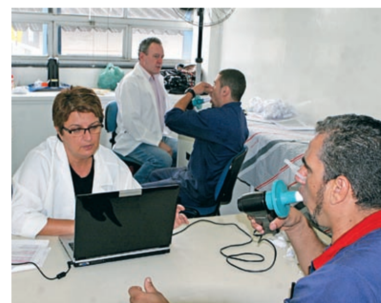
Testes são realizados na própria empresa